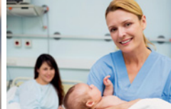
● Entbindungspfleger ● Hebamme