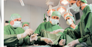
●/● Operationstechnische/r Assistent/-in