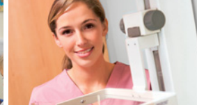
●/● Medizinisch-technische/r Assistent/-in