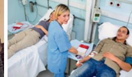
●/● Gesundheits- und Krankenpfleger/-in