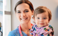
●/● Gesundheits- und Kinderkrankenpfleger/-in